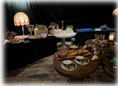
-Julebord for seniorer i samarbeid med Vågsøy Pensjonistlag