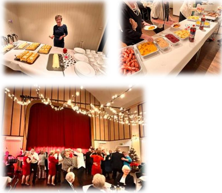
-Bilder fra konsertkåseri på Bryggja i samarbeid med Bryggja Pensjonistlag og Stad kommune.