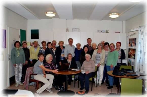
En nettkafé-tirsdag på Frivilligsentralen(2018)

Frivilligsentralen organiserte Seniornett frem til det ble dannet eget styre. De er nå sjølvstyrte, men kan kontakte frivilligsentralen ved behov. I 2014 ble dei registrert som forening og fikk eget organisasjonsnr i Brønnøysundregisteret. Våren 2024 blei det dessverre bestemt avvikling av Seniornett Vågsøy.